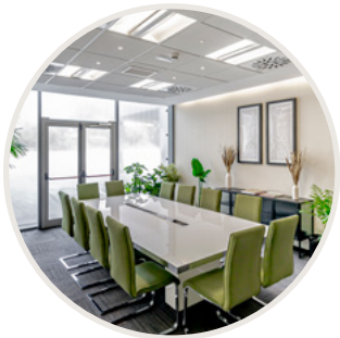
Sala de reuniones

Junto a éste se encuentra la zona de cafetería , un lugar de pausa y encuentro que da paso a la terrazza exterior con espacios verdes , idónea para disfrutar de un café o seguir trabajando a tu aire.